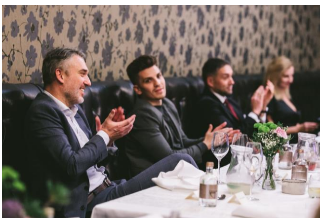
Účastníci podujatia / Event participants