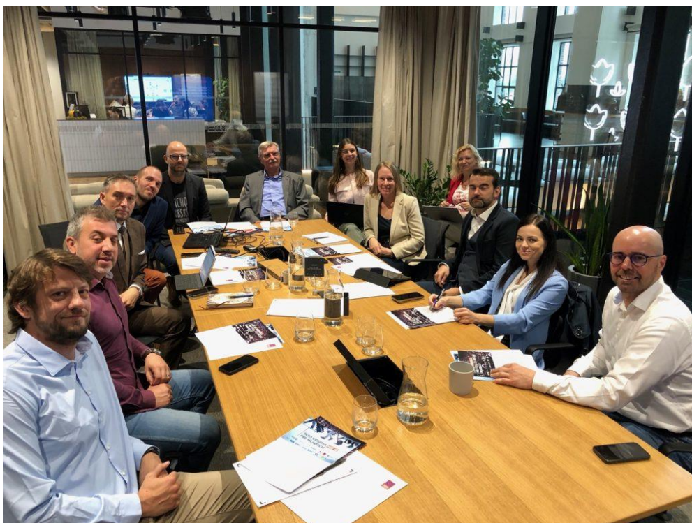
Stretnutie zástupcov iniciatívy / Meeting of representatives of Initiative

That is why the organisations associated in the 'Rule of Law Initiative' have expressed their disapproval and concern about the current state of the legislative process in Slovakia and the associated proposals that are submitted through the abbreviated legislative procedures.