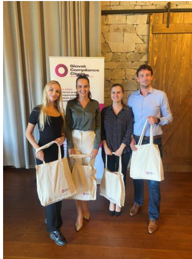
Víťazi záverečného kvízu Winners of the final quiz