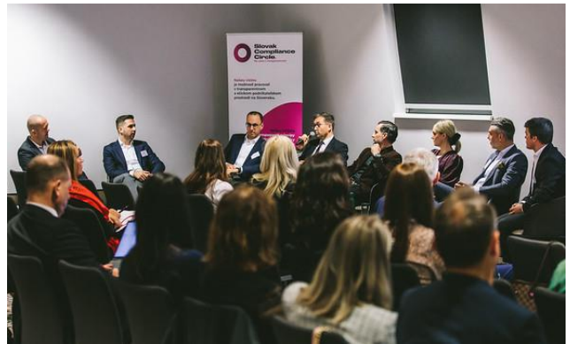
Panelová diskusia s členmi predstavenstva SCC Panel discussion with the Board of Directors of the SCC

The main theme of the conference was global challenges in the context of current problems that affect the business of domestic as well as foreign companies.