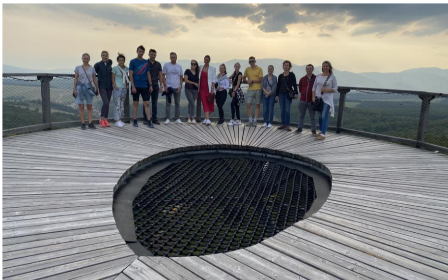
Spoločný výstup na rozhľadňu / Hiking to the observation tower