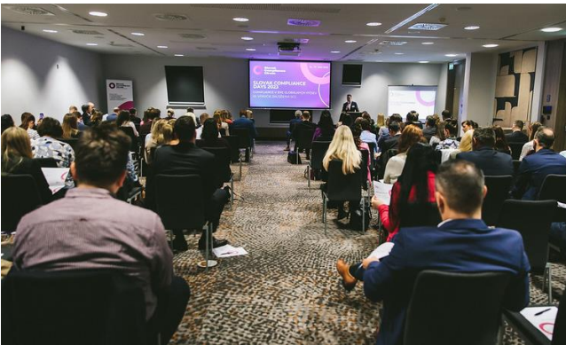
Otvorenie prvého dňa konferencie Opening of the first day of the conference

Nosnou témou konferencie boli globálne výzvy v kontexte aktuálnych problémov, ktoré ovplyvňujú podnikanie domácich ale aj zahraničných spoločností.