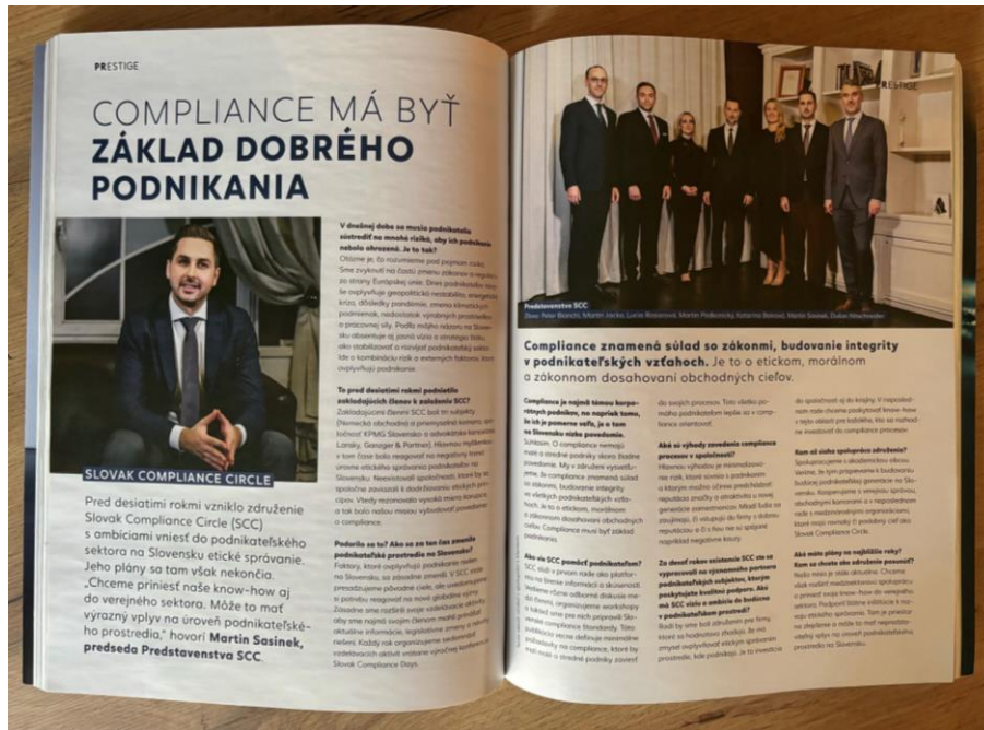
Článok o Slovak Compliance Circle v magazíne Forbes, decembrové vydanie Article about Slovak Compliance Circle in Forbes magazine, December edition