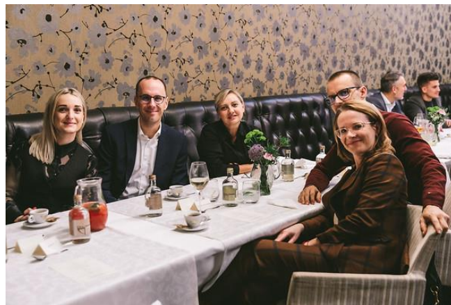
Účastníci podujatia / Event participants