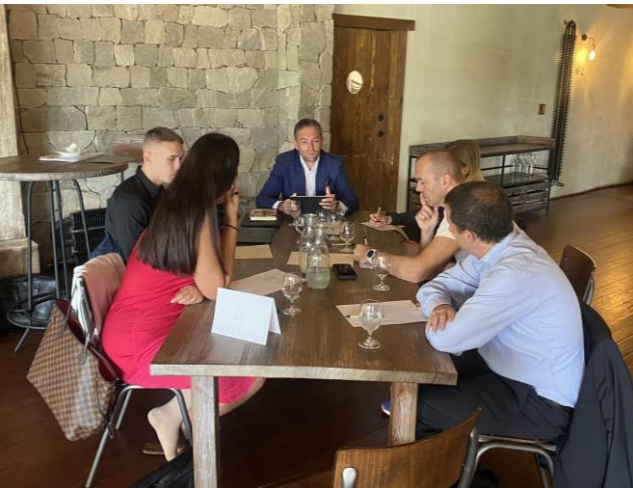
Účastníci jesenného workshopu počas práce v skupinách / Autumn workshop participants during group work

Po tejto časti nasledoval zaujímavý kvíz s 20 otázkami zo všetkých tém, ktoré sa prebrali. Niektoré otázky boli malé prípadové štúdie a kvíz mal aj svojich víťazov.