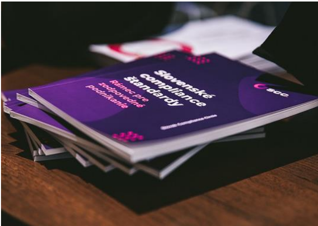
Slovenské compliance štandardy boli prezentované na viacerých podujatiach Slovak compliance standards were presented at several events