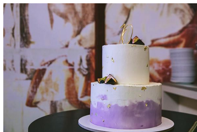
Sladké prekvapenie / Sweet surprise