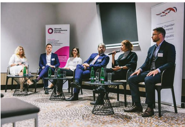
Hostia panelovej diskusie BritCham Guests of the panel discussion of BritCham

The evening program was also interesting, where a jazz concert with refreshments was prepared for the participants.