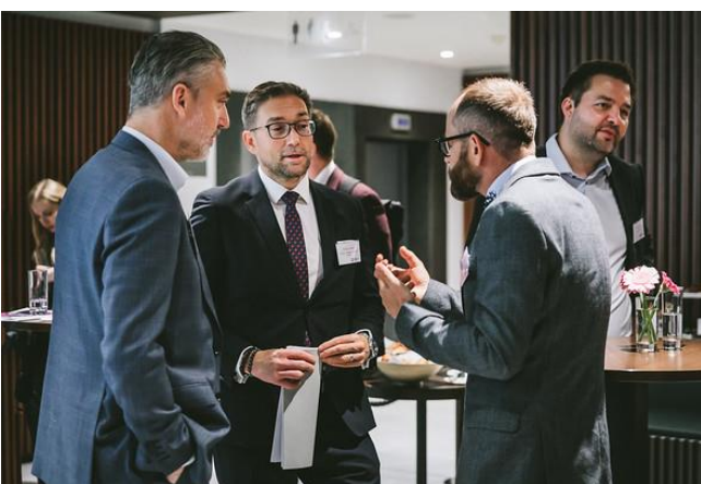
Účastníci konferencie počas prestávok / Participants of the conference during coffee breaks