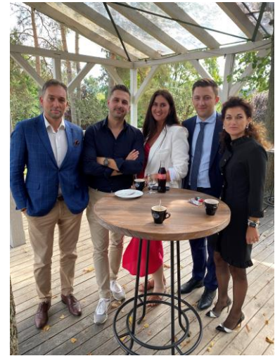
Účastníci workshopu Workshop participants