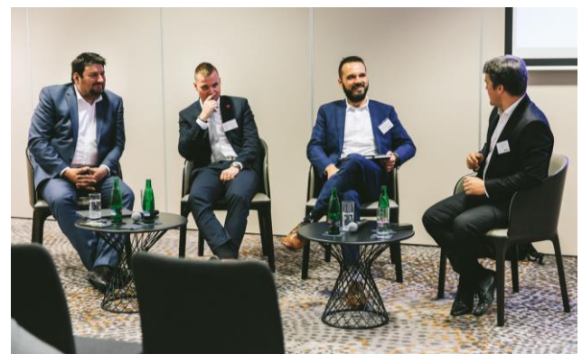
Panelová diskusia / Panel discussion