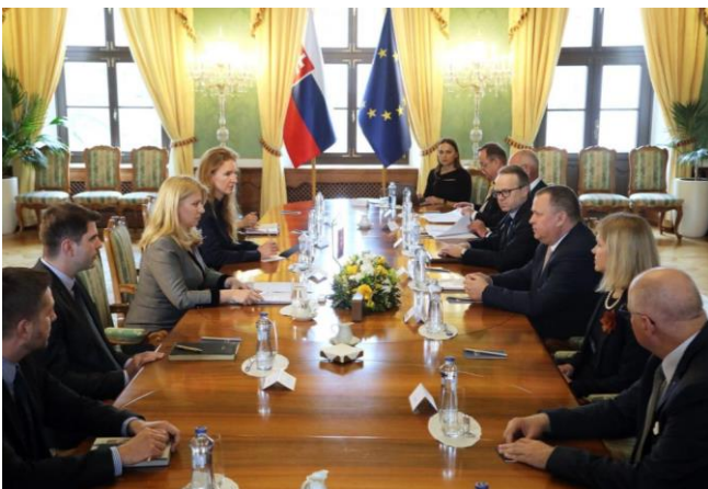
Stretnutie predstaviteľov iniciatívy s pani prezidentkou Meeting of the representatives of the initiative with the President

September 2023 – Dňa 5.9.2023, iniciatíva organizovala veľkú predvolebnú diskusiu so zástupcami relevantných politických strán.