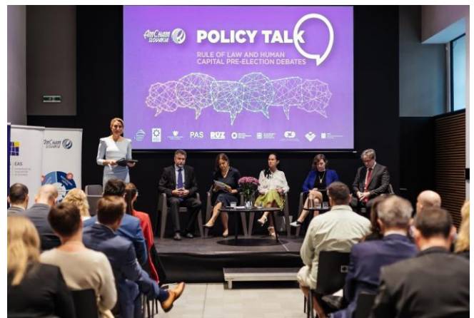
Predvolebná diskusia s kandidátmi do volieb do NR SR Pre-election discussion with candidates for the elections to the National Council of the Slovak Republic

September 2023 – On 5.9.2023, the initiative organised a major pre-election debate with representatives of the relevant political parties.