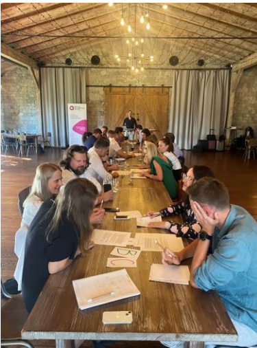
Záverečný kvíz v skupinách Final quiz in groups

The second day was devoted to the internal affairs of the association, where, for example topics for further workshops were defined and important information was collected from the members of the association for its further development. This event is extremely popular with members because, in addition to professional topics, there is space for sharing experiences in the field of compliance and getting to know each other.