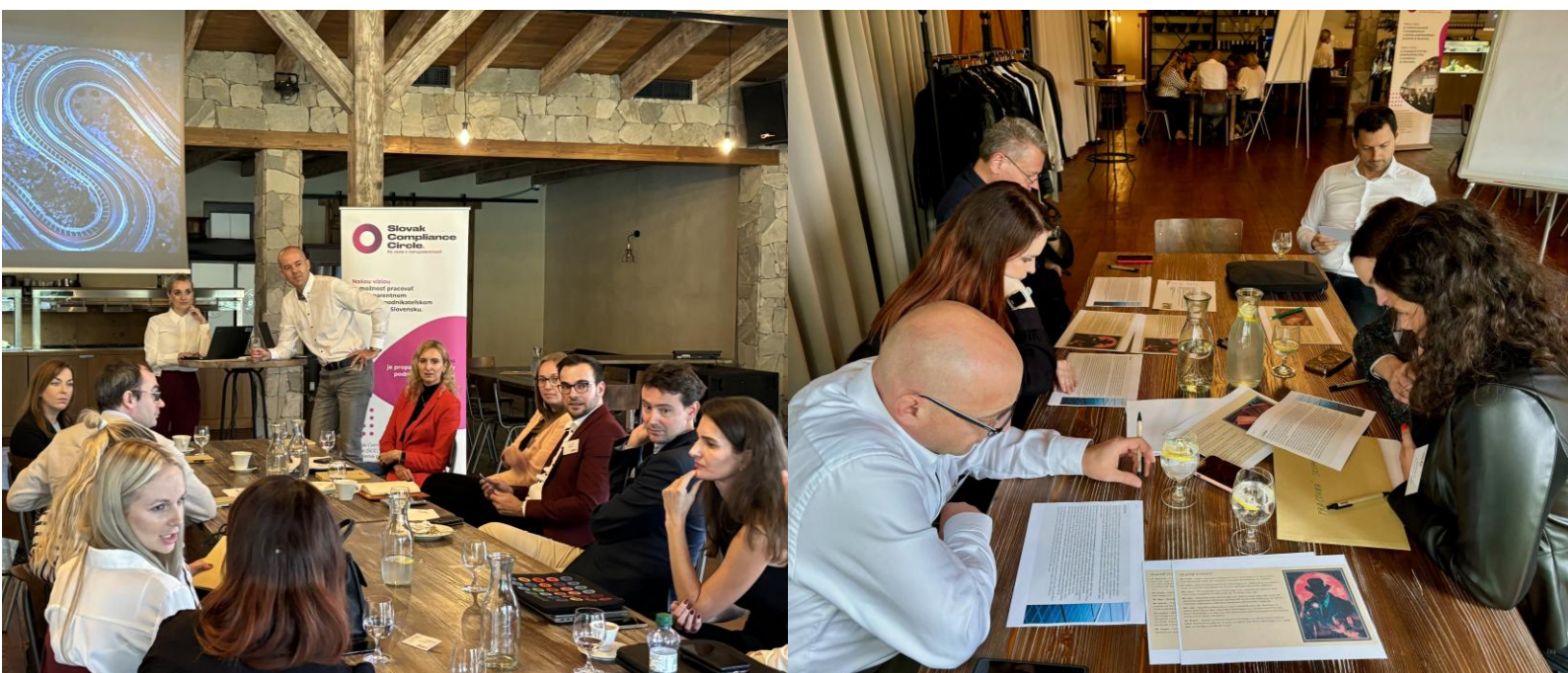
Účastníci jesenného workshopu počas diskusie a v pracovných skupinách Participants of the autumn workshop during the discussion and in working groups

At the same time, the workshop provided the participants with a unique opportunity to get to know each other better, exchange experiences and strengthen mutual relationships.